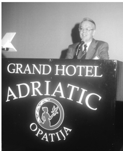
Na jednom od brojnih predavanja...

U svojim rubrikama u KVIZ-u (Odabrani problemi profesora Cosinusa) i KVIZORAMI (Profesor Pitagora) dr. Kurnik je objavio više tisuća matematičkih zagonetki te na taj način doprinio popularizaciji matematike. I u časopisima Matematičko-fizički list i Matka ima stalne rubrike iz popularne matematike. U prvom je to rubrika Zabavna matematika, a u drugom Enigmatka.