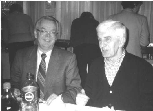
U uredništvu MS -a...

Svoj interes za nastavu matematike, posebice njezinu metodiku i didaktiku, dr. Kurnik je okrunio svojim predavanjima u okviru kolegija Metodika nastave matematike na Matematičkom odjelu PMF-a u Zagrebu. No on se nije zadržavao samo u akademskim vodama, već je vrlo predano sudjelovao u svim djelatnostima vezanim uz školu i svakodnevni nastavni rad. Tako je primjerice dugogodišnji predsjednik Državnog povjerenstva za natjecanja učenika u matematici te ispitivač na stručnim ispitima. Član je redakcija svih matematičkih časopisa u zemlji, Matematičko-fizičkog lista, Poučka, Matke i Matematike i škole. Posebice je naš MS nezamisliv bez njegova udjela i kao autora stalne rubrike “Rječnik metodike” i kao kreatora samog časopisa. Na suradnji smo mu uistinu iskreno zahvalni.