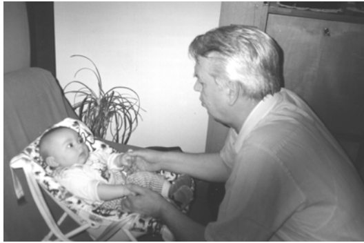
Prvo predavanje unuku!