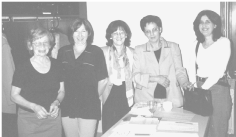
Simpatične profesorice "domaćice"