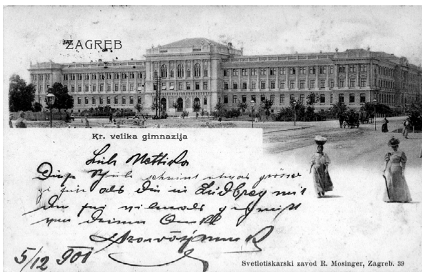
Zgrada gimnazije na Rooseveltovom trgu (1901. g.)

bilo ukidanjem gimnazija) grubo povrijeđen ponos građanskog Zagreba te prekinut prirodni tijek jedne lijepe tradicije.