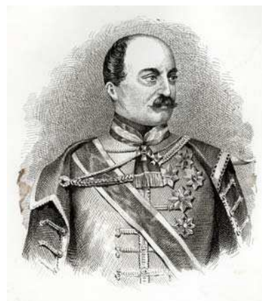
Ban Josip Jelačić

Prve godine svojega djelovanja zagrebačka Mala realka bila je smještena u Grkokatoličkom sjemeništu na Griču, u Gospodskoj (danas Čirilometodskoj) ulici. Sljedeće se godine preselila u pučku školu kod Popovog tornja (kraj današnje zvezdarnice). No kako je rastao broj učenika, javila