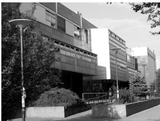
Zgrada Prve i Četvrtke gimnazije u naselju Utrina u Novom Zagrebu

Za matematičare je osobito zanimljivo što se kroz povijest Prve gimnazije može pratiti kako se razvijala nastava matematike u Hrvatskoj tijekom više od 100 godina. Tako je primjerice, iz pregleda učevnih sati za školsku godinu 1904./05. (vidjeti presliku!) vidljivo da je matematika u tadašnjim školama bila daleko najzastupljeniji predmet. Uz “matematiku” tu su bila još i dva predmeta u koji-